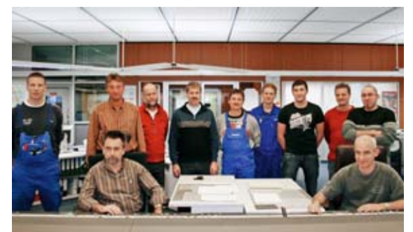
Kernkraftwerke sichern Arbeitsplätze – hier in der Warte einer Anlage in Bayern.

Auch zehntausende Arbeitsplätze bei Zuliefer- und Servicefirmen, bei Gutachtern und Behörden an den Standorten und weit darüber hinaus sind abhängig vom Betrieb der Kernkraftwerke. Insgesamt profitieren im Umfeld eines Kernkraftwerks im Durchschnitt mehr als 2.000 Dienstleister vom Betrieb des Kraftwerks – vom Bäcker um die Ecke bis zum Gerüstbauer. Der Umsatz dieser meist mittelständischen Fremdfirmen liegt in Summe jährlich im zweistelligen Millionenbereich.