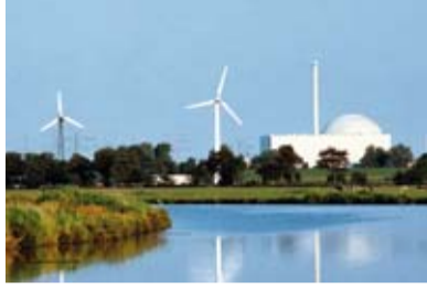
Flexible Regel-Po- wer für die Rege- nerativen Seite 3