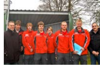
Viel Energie für die Kraftwerks- nachbarn Seite 4

„Großer Kundendienst“ für das Kernkraftwerk Brokdorf: Vom 15. Mai bis 7. Juni absolvierte die Anlage die planmäßige Jahresrevision 2010.