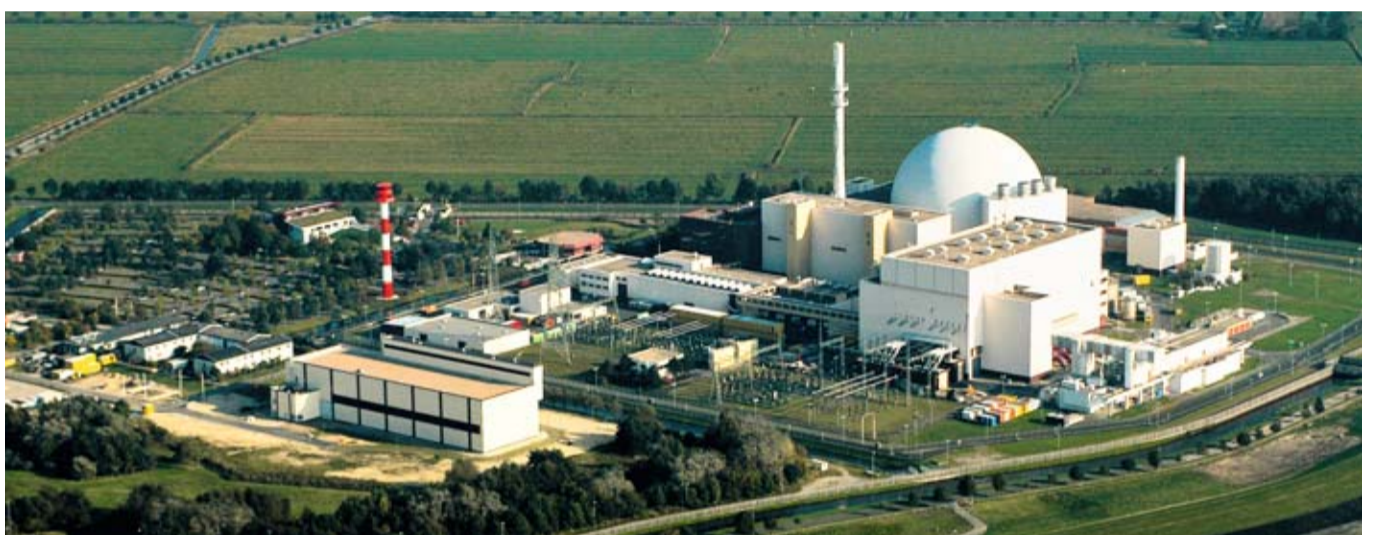
Das Kernkraftwerk Brokdorf bietet Nachwuchs-Akademikern die Möglichkeit, Erkenntnisse für ihr Studium zu finden.

Das Kernkraftwerk Brokdorf ist nun fit für die nächste „Reisezeit“: 52 der insgesamt 193 Brennelemente wurden durch neue ersetzt. Insgesamt beinhaltet das umfangreiche Inspektions- und Instandhaltungsprogramm mehrere tausend Einzelaufträge. Die zuständige atomrechtliche Aufsichtsbehörde sowie die von ihr hinzugezogenen Sachverständigen überwachten alle sicherheitstechnisch relevanten Arbeiten und bestätigten den guten Zustand der Anlage. Für die Region war die Kraftwerks-Inspektion auch in diesem Jahr ein starker Wirtschaftsimpuls: Im Revisionszeitraum kamen knapp 1.400 externe Fachkräfte aus unterschiedlichsten Servicefirmen zusätzlich zum Einsatz. Insgesamt investierte das Kraftwerk für die Revisionsarbeiten rund 30 Millionen Euro.