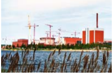
Neue Kernkraftwerke: Die Zukunft hat begonnen Seite 2