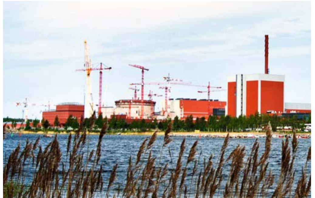
Gerade im Bau: der EPR-Reaktor im finnischen Olkiluoto.

Mehrere andere Reaktorkonzepte stehen auf dem Prüfstand der Realisierung: Verschiedene Euratom-Mitgliedsländer sowie Japan und Südkorea arbeiten zum Beispiel an der Optimierung des Hochtemperaturreaktors. Dieser sogenannte Kugelhaufenreaktor, der seinen Namen durch die kugelförmigen und etwa tennisballgroßen Brennelemente erhält, wurde ursprünglich in Deutschland entwickelt. Durch die hohen Prozesstemperaturen von 950°C