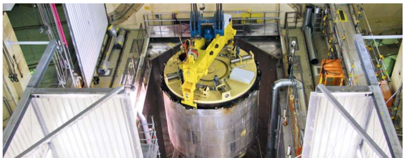
Der Rückbau des Reaktordruckbehälters ist eine große Herausforderung für die Betriebsmannschaft des Kernkraftwerks Stade.

E.ON Kraftwerke plant in Stadersand ein leistungsfähiges Steinkohlekraftwerk der neuesten Generation. Jetzt hat E.ON Kraftwerke einen weiteren Schritt auf dem Weg zum Bau vollzogen: Ende April reichte das Unternehmen den Antrag auf die Erstellung eines vorhabensbezogenen Bebauungsplans bei der Stadt Stade ein. Zwischenzeitlich haben die Gremien der Stadt diesem Antrag zugestimmt, so dass die Stadtverwaltung jetzt einen Bebauungsplan für das E.ON Gelände in Stadersand aufstellen kann. Der Standort ist als Großkraftwerksstandort ausgewiesen und bietet mit seiner Anbindung an das europäische Stromverbundnetz sowie der Lage am seeschifftiefen Wasser der Elbe optimale Voraussetzungen.