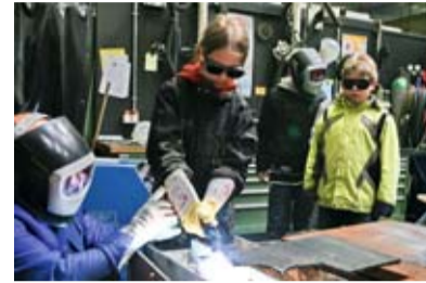
Ein Erlebnistag im Kernkraftwerk Seite 4

Mit 12.000 Euro „Energiespar-Bonus“ hat das E.ON Kernkraftwerk in Stade drei Gymnasien im Landkreis prämiert.