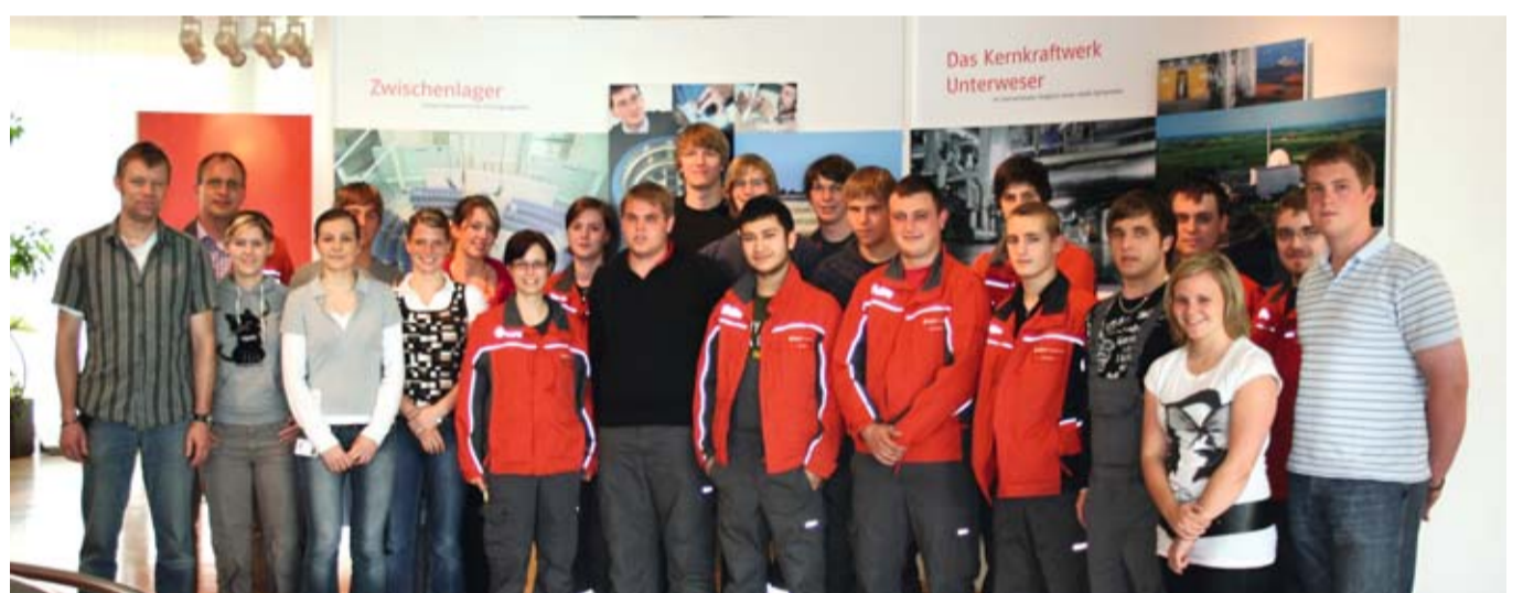
Die Auszubildenden des KKK

Alles Wissenswerte über das KKK finden Sie auch ganz bequem im Internet - unter der Adresse www.eon-kernkraft.com/unterweser . Der Internetauftritt des Kraftwerks lädt Sie ein zu einer virtuellen Reise durch die Welt der Kernkraft: Dort können Sie in der Geschichte der Anlage stöbern oder sich darüber informieren, wie viel sauberen Strom das Kraftwerk in den vergangenen Jahren erzeugt hat. Mehr aktuelle Informationen über die Kernenergie in Deutschland finden Sie auch auf den Seiten der E.ON Kernkraft, www.eon-kernkraft.de . Klicken Sie doch einfach einmal rein!