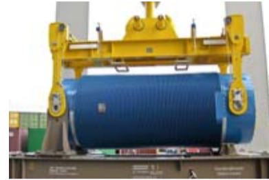
Sichere Ladung für das Zwischenlager Seite 4

Anfang August startet im KKK die planmäßige Jahresrevision. Mehrere tausend Arbeitsaufträge sind geplant.