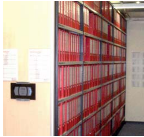
Ein Blick ins Archiv

Das Archiv ist ein Sammelzentrum der Superlative: 15 Mitarbeiter sind damit beschäftigt,